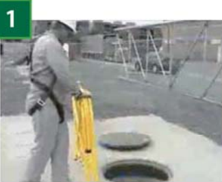
1 バリケードを設置場所に運びます。