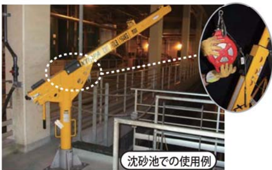
沈砂池での使用例

アームに、マストとフロアアダプターを取付けて固定できます。 槽や池等の安全対策に最適です。