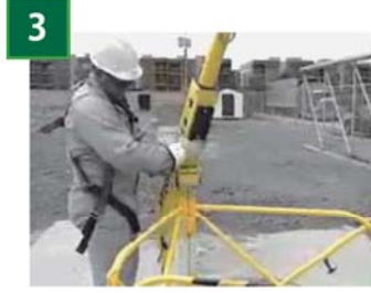
3 アームを取付けます。