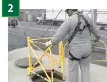
2 バリケードを広げます。