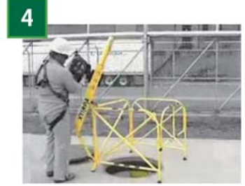
4 ウィンチを取付け完成。