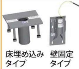
床埋め込み タイプ